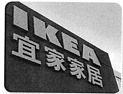
De winkels van IKEA staan in veel landen.

De haven van Rotterdam is in de oorlog flink verwoest. Maar de haven is snel weer opgebouwd en wordt de grootste containerhaven van Europa. Mensen gaan steeds meer reizen, met de auto of het vliegtuig. De VS en de Sovjet-Unie strijden met elkaar in de ruimte. De eerste man in de ruimte is een Rus. Maar de eerste maanlanding komt op naam van de VS. Er zijn in de ruimte inmiddels ook satellieten. Dat zijn kunstmanen die informatie kunnen versturen van de ene plek op aarde naar de andere, via de ruimte. Bijvoorbeeld tv-beelden of internetgegevens. Daardoor kan iedereen gemakkelijk informatie verzamelen en delen. We noemen deze tijd daarom het informatietijdperk. Grote bedrijven bouwen winkels, kantoren en fabrieken in andere landen. Dit noem je de globalisering. Deze bedrijven zijn niet meer aan één land gebonden. Het zijn multinationals.