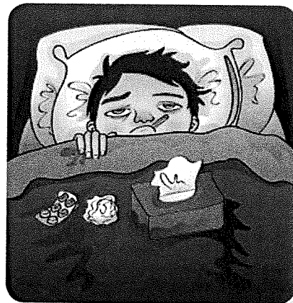
Als je griep hebt, strijdt je lichaam tegen het griepvirus.

Mensen die suikerziekte hebben, spuiten elke dag insuline in hun bloed. Insuline is een stof die ervoor zorgt dat er niet te veel suiker in je bloed komt. Geneesmiddelen kun je op verschillende manieren in je bloed brengen: door een injectie, een pil, een drankje, een pleister, een zalf of een zetpil. Als je veel bloed hebt verloren, kun je via een transfusie bloed krijgen van iemand anders. Iemand die bloed geeft voor een transfusie heet een bloeddonor. Niet iedereen heeft hetzelfde soort bloed. Er zijn acht bloedgroepen. Je kunt alleen bloed krijgen van een bloedgroep die bij jouw bloedgroep past.