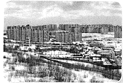
In het noorden van Rusland heerst een poolklimaat.

De wereld is verdeeld in tijdzones. Rusland is zo groot, dat er wel negen tijdzones zijn. In het oosten van het land is het negen uur later dan in het westen. Doordat het land zo groot is, komen er ook verschillende klimaten voor. In het noorden heerst een poolklimaat. Het is er erg koud. Daardoor is de grond er altijd bevroren. Dat noem je permafrost. Waar de permafrost ophoudt, begint de taiga. Op de taiga groeien enorme naaldbossen. In het midden van Rusland heerst een landklimaat. Bijvoorbeeld in Moskou. De zomers zijn er vrij warm en de winters heel koud. In het zuiden van Rusland is het lekker warm. Er groeien zelfs palmbomen. Daar heerst het Middellandse Zeeklimaat.