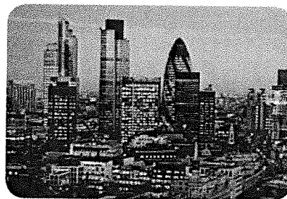
Londen is een wereldstad.

West-Europa is dichtbevolkt. De meeste mensen wonen in de stad. Londen is de grootste stad van West-Europa. Het is een wereldstad. Een wereldstad heeft meer dan één miljoen inwoners. In zo'n wereldstad wonen en werken veel mensen. Zij reizen in de stad vaak met de metro. Als ze met de auto gaan, staan ze in een lange file. Het wegennet rond veel grote steden is vaak niet groot genoeg voor alle auto's.