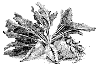
Suikerbieten zijn de grondstof voor suiker.

Een fabriek is een bedrijf dat met machines producten maakt. Vaak staat een fabriek dicht bij de plek waar de grondstof voor de producten vandaan komt. Een snoepfabriek staat bijvoorbeeld vaak dicht bij de plek waar suikerbieten groeien. Een snoepfabriek is een voorbeeld van de voedingsindustrie: het is een fabriek die voeding maakt. Van suikerbieten wordt eerst suiker gemaakt. De suiker is een halfproduct: er wordt nog iets anders van gemaakt: snoep! Een fabriek, maar ook alle andere bedrijven waar mensen werken, is een werkgever. Mensen die bij een bedrijf werken zijn de werknemers van dat bedrijf.