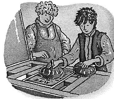
Met inktballen smeert je inkt op de letters.

In deze tijd ontdekken geleerden nog meer. Ze ontdekken dat de aarde om de zon draait. Ze ontdekken ook het kompas. Dat helpt ontdekkingsreizigers zoals Columbus om over zee Amerika te ontdekken.