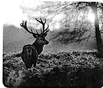
In de winter zijn de dagen kort en de nachten lang.

De zon komt elke dag op dezelfde plek op. Dat moment heet zonsopkomst. En elke dag gaat de zon aan de andere kant weer onder. Dat heet zonsondergang. De zon gaat van de ene naar de andere kant. Dat komt doordat de aarde langzaam ronddraait. In de zomer komt de zon eerder op en gaat ze later onder dan in de winter. 21 juni is de langste dag. Dan is het het langst licht. De kortste dag is 21 december. Dan is de tijd tussen zonsopkomst en zonsondergang het kortst. Op de kortste dag begint de winter. Dat is één van de vier seizoenen. In de winter groeit er weinig. Aan het eind van de winter gaat het sneeuwklkje bloeien. In de lente worden de dagen langer en gaan er meer bloemen bloeien. De langste dag is het begin van de zomer. In de herfst worden de dagen steeds korter. De bladeren vallen en de dieren verzamelen voedsel voor de winter.