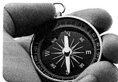
De naald van een kompas wijst altijd naar het noorden.

De noordpool en de zuidpool van de aarde kunnen ook voorwerpen van ijzer aantrekken. Neem bijvoorbeeld een kompas. De naald van een kompas is een soort magneetje. Hij wijst altijd naar de noordpool. Magneten worden ook gebruikt om ijzeren voorwerpen in de maag van een koe vast te houden. Dat heet een koeienmagneet.